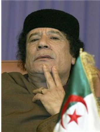
De Libische leider Moammer Gadhafi