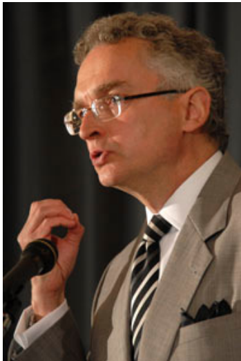
Luitenant Kolonel Ralph Peters

Volgens velen laten dat de Europese leiders zich als willoze marionetten door de islam misbruiken en daarmee Europa aan het verkwanselen zijn. De Amerikaanse commentator Ralph Peters, heeft daar echter een heel andere mening over. Hij is in tegenstelling tot wat velen geloven, dat de islam uiteindelijk de macht in Europa zal overnemen, een volstrekt tegenovergestelde mening toegedaan. Europa wordt volgens hem niet bedreigd door 'Eurabië', maar zegt dat de moslim minderheden in Europa in geleende tijd leven. Dit omdat de Europeanen naar het oordeel van Peters 'tot genocide geneigde maniakken' zijn, die met 'verbijsterende hardheid' zullen terugslaan wanneer ze zich inderdaad door hun moslimse immigranten bedreigd zullen gaan voelen. Hij voorspelt dat er een moment zal komen dat Amerikaanse schepen 'in Bremen, Bari en Brest' de moslimse vluchtelingen uit Europa zullen moeten komen ophalen. http://www.nypost.com/seven/11262006/postopinion/opedcolumnists/the_eurabia_myth_opedcolumnists_ralph_peters.htm?page=0