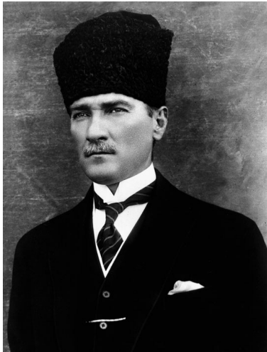
Mustafa Kemal Atatürk, bijgenaamd Vader der Turken, was als bevelhebber verantwoordelijk was voor de slachting in Smyrna.

Prophet” schrijft Serge Trifkovic: “Tijdens de lange strijd voor onafhankelijkheid, hebben de Grieken een zeer hoge prijs betaald met bloed en tranen.” Over de geschiedenis van Turkse overheersing van de Grieks Orthodoxe christenen schrijft Trifkovic: “Het verbranden van de Griekse stad Smyrna en de massaslachting van 300.000 christelijke bewoners is één van de meest beestachtige slachtpartijen van moslims jegens christelijke bevolkingsgroepen. Het is één van de bloedigste misdaden in de hele geschiedenis. Het markeerde het eind van de Griekse gemeenschap in Klein Azië”. Wat Allah’s volgelingen uit zijn naam in deze plaats hebben aanricht is onvoorstelbaar. Terwijl de Westerse vloot in de haven toekeek, werden 300.000 christenen vermoord. De officieren hadden de grootste moeite om met hun sloepen bij de schepen te komen, vanwege de enorme aantallen lijken in het water. De schroeven raakten vast door de lijken die in het water dreven en wanhopige drenkelingen die via de ankerkettingen aan boord van de schepen probeerden te komen, werden in het water teruggeduwd. De westerse regeringen waren volledig op de hoogte van deze slachting. Zie voor een compleet verslag: van deze moordpartij zie: http://www.greece.org/genocide/smyrna1922.htm en ook: http://www.ellopos.net/politics/turkey-blight/excerpts.asp