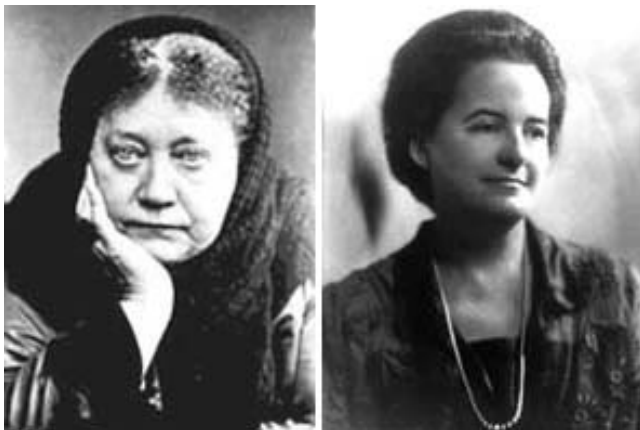
Links Helena Blavatsky, rechts Alice Baily.

Zoals christenen een naam hebben bij God, die geschreven staat in het Boek des Levens, zo zijn er ook mensen die een naam hebben in het rijk der duisternis. Zij krijgen vanuit die wereld allerlei gaven en occulte inspiratie toebedeeld en genieten een zekere 'bescherming' van hun 'Meesters' (demonen). Tot de meest bekende woordvoerders van de 'Meesters' behoren de eerder genoemde Alice Baily en Helena Blavatsky.