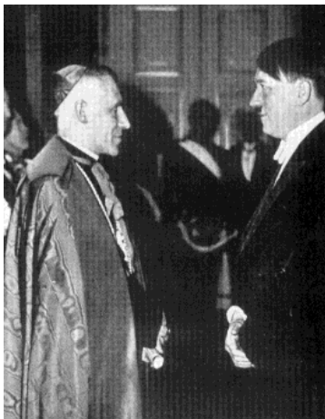
Aartsbisschop Cesare Orsenigo en Hitler

Sinds de 4 de eeuw zijn er drie anti-Joodse strategieën gevolgd: (gedwongen) bekering, verbanning en uitroeiing. De christelijke zendelingen/ missionarissen zeiden: "je hebt geen recht om onder ons als Joden te leven." De wereldse heersers zeiden: "je hebt geen recht onder ons te leven." De nazi's zeiden: "je hebt geen recht om te leven." Als de kerk zich eens serieus zou bezinnen op haar oorsprong dan komt ze bij Israël terecht, want de kerk wortelt in Israël. In het christelijk Europa was het mogelijk dat een niets ontziende barbaarse ideologie tallozen in haar greep kreeg. Christelijk Europa gaf nazi-Duitsland de kans om haar duivelse plannen voor de uitroeiing van het Joodse volk te volvoeren. Reeds in 1933 gaven de Duitse kerken, zowel de protestantse als de katholieke zich over aan het nazisme en Jodenhaat. Er rust daarom een zware schuld op de volken en kerken in Europa.