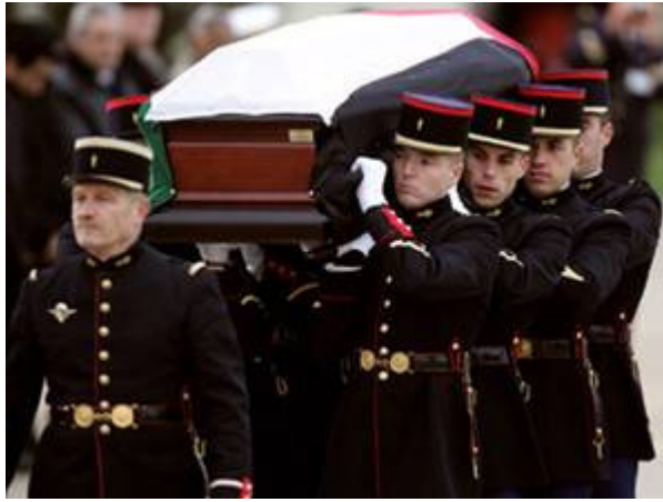
Het lichaam van de terreurbaas wordt hier gedragen door leden van de Franse Republikeinse Garde op 11 november 2004 op het militaire vliegveld Villacoublay.

Onmiddellijk na zijn dood verklaarde een woordvoerder van het Fatah/PLO bewind dat Israël hem zou hebben vergiftigd. Prompt nam een deel van de internationale media deze totaal niet bewezen berichten over. Zijn persoonlijke arts kwam echter met een heel ander verhaal en zei dat alle symptomen erop wezen dat hij aan Aids is gestorven. De radiozender van ABC