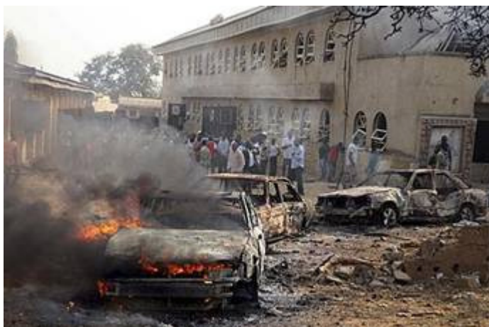
Aanslag kerstdagen 2011

Tijdens de kerstdagen van 2011 zaaide Boko Haram opnieuw dood en verderf. Bij een zware aanslag op een kerk in een buitenwijk van hoofdstad Abuja kwamen zeker 35 mensen om het leven. Een aantal huizen en auto's nabij de kerk liepen eveneens schade op.