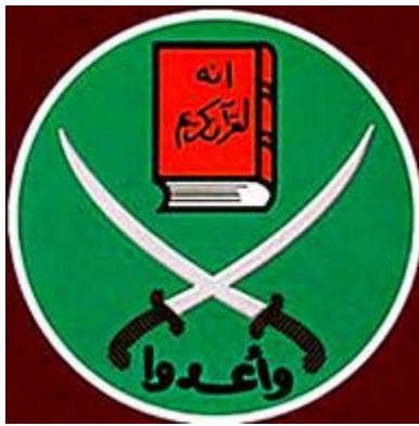
Het 'vredelievende' logo van de Moslim Broederschap

En dan te bedenken dat deze figuren de openlijke steun en volledige sympathie genieten van de grote baas in Washington, Barack Hoessein Obama . Zelfs de leiders van de FBI, CIA en hooggeplaatste militaire leiders kletsen politiek correct om de grote baas op dit punt niet te irriteren. Hij heeft heel bewust de kant van de islamfascisten gekozen en laat zich zelfs adviseren door leden van de Moslimbroederschap betreffende zijn Midden-Oosten politiek . Hij stond volledig achter de omverwerping van het bewind van Hosni Moebarak. Maar sinds de val van Moebarak is de economische situatie voor de Egyptische bevolking ronduit desastreus, de christenen worden geconfronteerd met verkrachtingen en moordpartijen en de roep om Israël aan te vallen wordt met de dag luider.