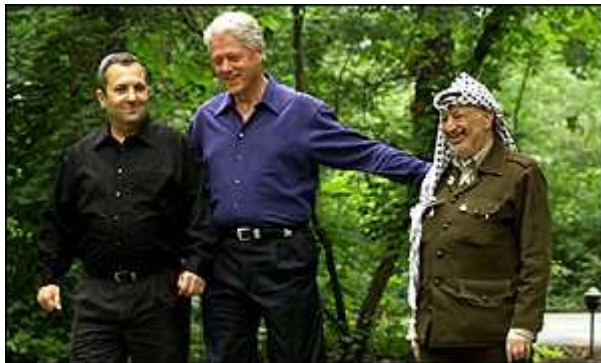
Camp David juni 2000: Ehud Barak –Bill Clinton en Jasser Arafat

De eisen zijn weer dezelfde als die van vliegtuigkaper en terreurmiljardair Jasser Arafat die na het mislukken van het Camp David overleg in juni 2000, de opdracht gaf tot de 2 e intifada. Tijdens dit overleg bood de toenmalige Israëlische regering onder leiding van Ehud Barak, de huidige minister van Defensie, Arafat een eigen staat aan in de Gazastrook en op maar liefst 95% van Israëls aloude thuisland. Daarnaast bleek Israël bereid zowel het oostelijk deel van Jeruzalem als ook de Tempelberg op te geven. Het leger zou uit Samaria en Judea vertrekken, met uitzondering van een klein aantal strategisch gelegen dorpen w.o. Ariël en Ma'ale Adomien. Barak kwam Arafat verder tegemoet dan al zijn voorgangers bij elkaar-inclusief Rabin en Peres.