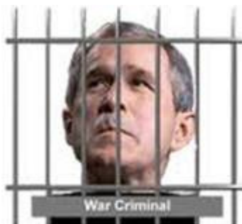
George W. Bush beschuldigd van oorlogsmisdaden

Voormalig Amerikaans president George W. Bush en een aantal van zijn medewerkers waaronder, vicepresident Richard Cheney en minister van defensie Donald Rumsfeld, zijn begin mei 2012 door het Kuala Lumpur War Crimes Tribunal in afwezigheid van oorlogsmisdaden beschuldigd.