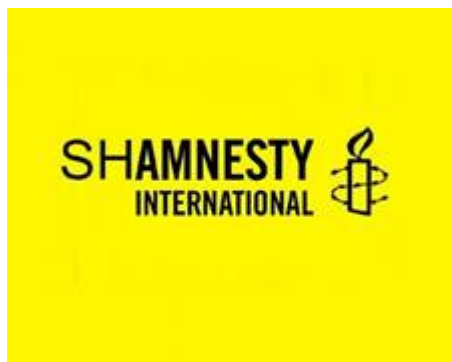
Amnesty International, schaam je!

Zoals wellicht bekend, is Amnesty International niet vies van ongehoorde aanvallen op Israël en schroomt daarbij niet zich te bedienen van valse en ongefundeerde beschuldigingen. Amnesty claimt: “Onafhankelijk van welke Overheid, politieke ideologie, economische interesse of religie te zijn, maar deze club wordt al lang niet meer beschouwd als een betrouwbare bron. De organisatie heeft een jaarlijks budget van 216 miljoen euro, en claimt een internationale organisatie te zijn met meer dan 3 miljoen supporters die zeggen te strijden voor de rechten van de mens. Men zou mogen verwachten dat deze organisatie dat ook daadwerkelijk in de praktijk brengt maar in hun rangen bevinden zich schaamteloze en vooroordelende onderzoekers die bij Amnesty ongestoord hun vuile werk kunnen doen. Deze organisatie houdt er een disproportioneel standpunt op na en opvallende partijdigheid wanneer het over Israël gaat. Het veroordeelt en demoniseert Israël, maakt vele valse claims in hun beschuldigingen, maar besteden bijvoorbeeld geen enkele aandacht aan het volledig ontbreken van mensenrechten onder het bewind van het Fatah/PLO bewind in Ram-allah.