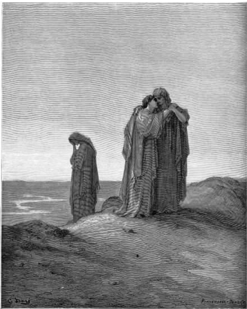
NAOMI AND HER DAUGHTERS-IN-LAW And Ruth said, Inherit me not to leave thee, or to return from following thee: for whither thou goest, I will go; and where thou lodgest, I will lodge: thy people shall be my people, and thy God my God. (Ruth 1: 16) (2 x 14)