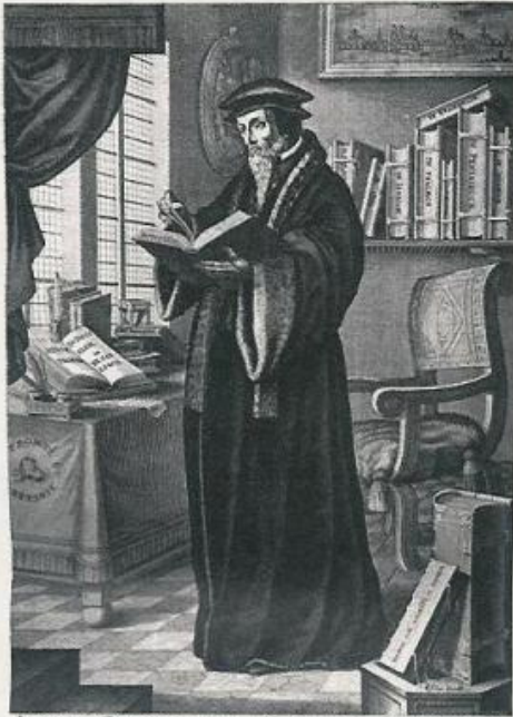
IOANNES CALVINUS NATVS NOVIODVNI PICARDORVM Natus X to 1509. et creatus Genevæ anno May X to 1541. Antiquæ ætatis vultus. Hæc sunt verba quæ scripsit ad Regem Franciæ anno 1541. "Je me suis consacré à Dieu et à son service et à la gloire de son saint nom. Et je ne suis en ce monde que pour le servir et pour le louer. Et je ne suis en ce monde que pour le servir et pour le louer." Calvinus in Genevæ die 27 May 1564. obiit. ætatis 55 annos. Portret in Hollandia.

1565). Deze probeert Calvin over te halen om in Genève te blijven en daar als reformator te gaan arbeiden. Calvin wijst Farel op zijn jonge leeftijd, zijn gebrek aan ervaring en de noodzaak van verdere studie, en slaat Farel's verzoek af. Daarop bezweert Farel hem: "Ik voorspel je, terwijl je jezelf inbeeldt dat je studie ten dienste van de almachtige God zal staan, dat, tenzij jij samen met ons je toewijdt aan het werk voor God hier, God je vervloekt als iemand die niet Christus, maar zichzelf zoekt." Calvin hoort in deze woorden Gods stem en blijft in Genève. Hij werkt daar eerst als prediker, daarna ook als pastor.