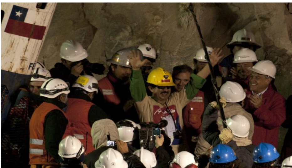
Vreugde en blijdschap!