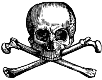
Skull & Bones logo