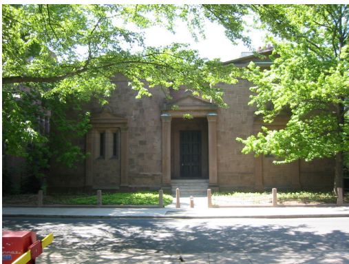
Skull & Bones Tempel in New-Hampshire, Connecticut.

De kandidaat is zogenaamd dood, vanwege het vlees, het materiële, waarin hij zit opgesloten, maar toch herrijst hij uit de doods-kist. Nadat hij is opgestaan wordt hij voor een leider gebracht die hem vertelt dat zijn geest voortaan voor eeuwig leeft en dat hij nu tot de "Verlichte Meesters" behoort. De leider maakt hem zijn nieuwe naam bekend en herinnert hem er aan dat allen buiten de "Orde" barbaren, vandalen en heidenen zijn. Zo kreeg George W.Bush de naam "Magog". De Orde heeft als attribuut de schedel van een mens wat zij beschouwen als het teken van leven en grote voorspoed. Daarnaast siert de "Swastika"(hakenkruis) de Tempel van de Orde. Elk jaar worden er vijftien nieuwe leden bij dit uiterst bizarre clubje occultisten ingewijd. Al deze figuren bekleeden topposities in de Amerikaanse samenleving. De doelstelling van de Orde is net als van de vele andere samenzweringen het oprichten van een Nieuwe Wereld Orde.