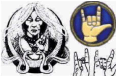
dit is het teken van hun verbondenheid met Satan

Het logo van de Skull&Bones is een schedel met daaronder twee gekruiste botten bekend van de piratenvlaggen. Onder het logo staat het kryptische getal 322, hetgeen een verborgen verwijzing naar Genesis 3:22 is; waar staat dat de mens geworden is als God, kennende goed en kwaad. En dat is het doel van deze mensen: goden worden.