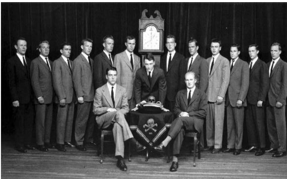
Skull & Bones gemeenschap. Yale Universiteit Connecticut (Links van de klok, George Herbert Bush)