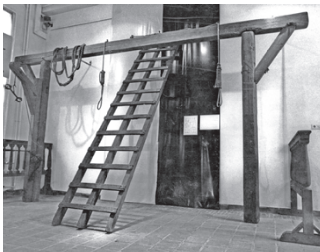
Een foto van de galg die destijds in Schiedam gebruikt werd. Ook Jillis Bruggeman werd tot de strop veroordeeld. c

Pielat van Bulderen dacht daar niet anders over. In de processtukken van Jillis Bruggeman werd een afschrift van het genoemde plakkaat opgenomen. Op grond van dit plakkaat werd hij overeenkomstig de eis en de conclusie van hoofdofficier Pielat van Bulderen door de schepenen van de stad Schiedam veroordeeld 12 om “door de scherprechter met de koorde te worden gestraft dat er de dood opvolgt”, wat inhield dat hij publiekelijk op de Grote Markt bij het stadhuis opgehangen werd, anderen tot een afschrik. Alleen met de eis van Pielat van Bulderen dat “het dode lichaam van de gevangene, als der begrafenis onwaardig, in een zak gebonden, met een kar of schuit vervoerd en in de zee geworpen zal worden”, gingen de schepenen niet mee.