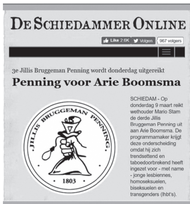
Een aankondiging - hier in een Schiedams medium - van de uitreiking van de derde Jillis-Bruggemanpenning. Deze uitreiking heeft op 9 maart 2017 plaatsgevonden in het oude raadhuis van Schiedam.